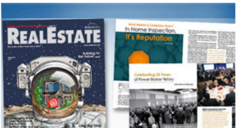
Read this month's issue now! Magazine