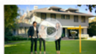
Fresh Face for Fall Videos